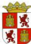
Comunidad Autónoma de de Castilla y León