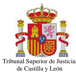
Tribunal Superior de Justicia de Castilla y León